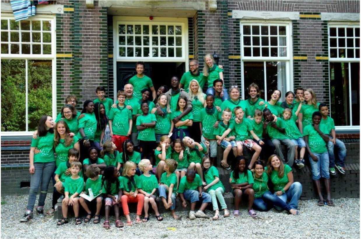
Kinderen en leiding van het Nash Dom kamp 2013!